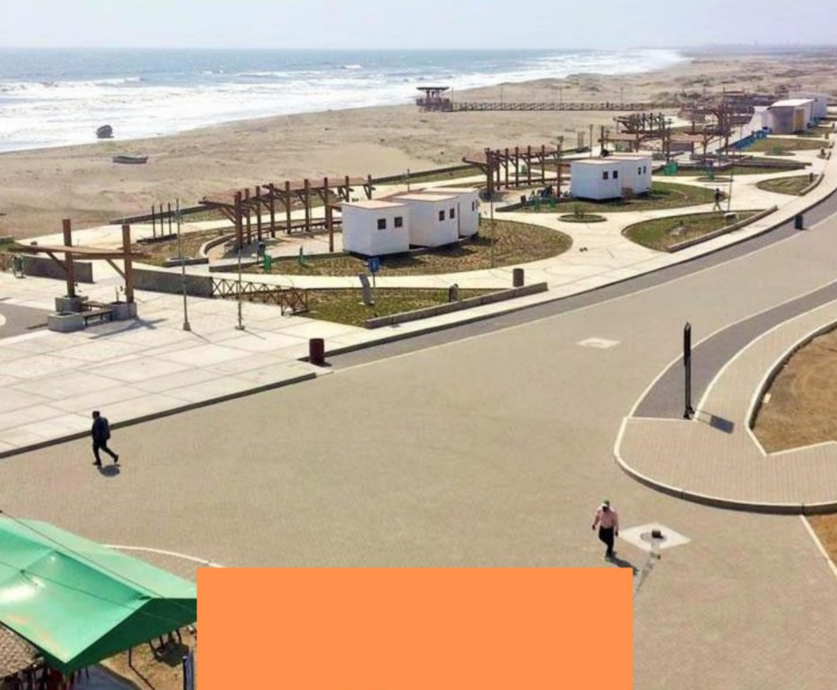
Playa Puerto Eten

Balneario de los mas concurridos en la provincia de Chiclayo , cuenta con el malecón mas grande del norte peruano.