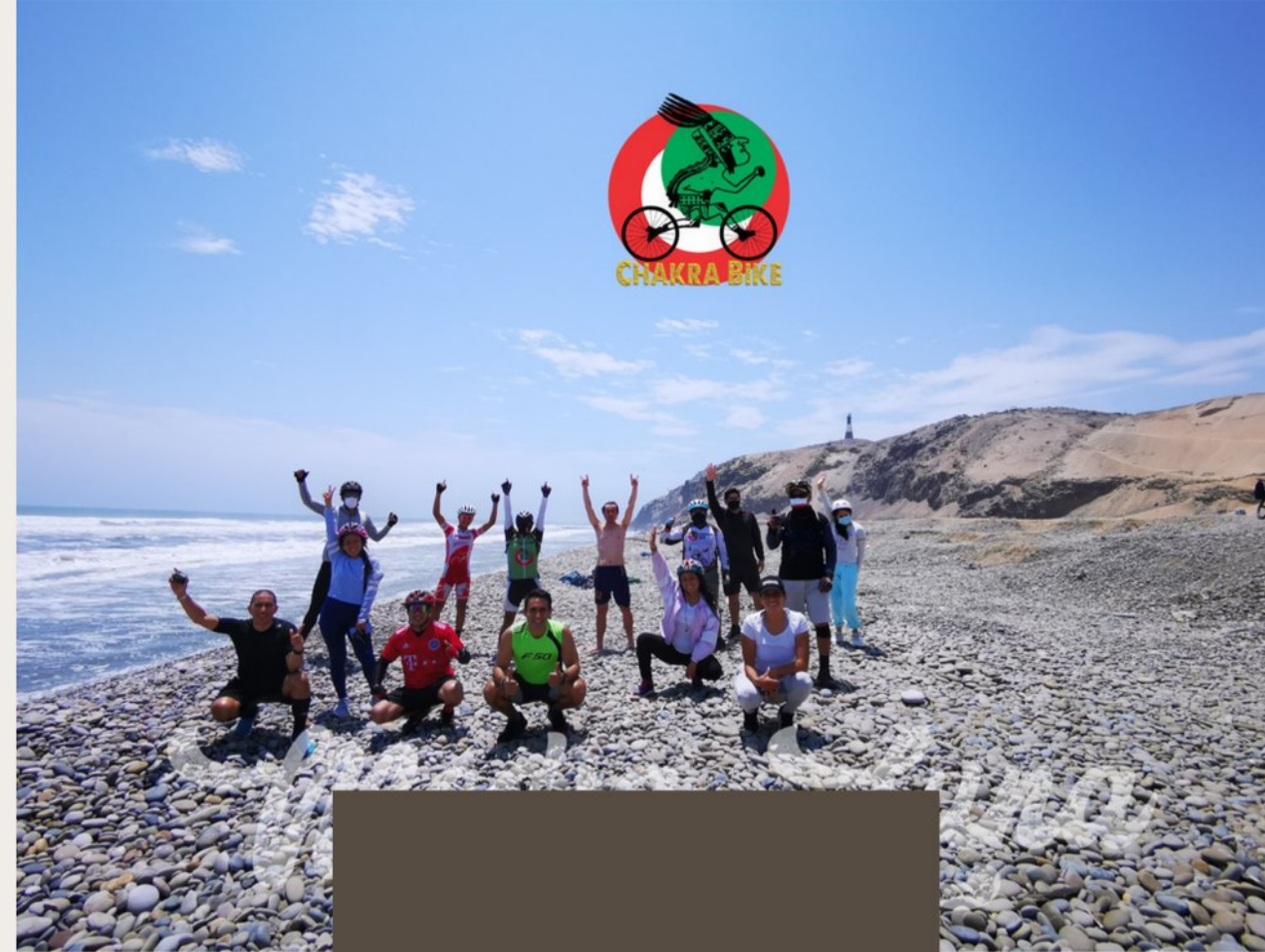
Playa Media Luna

Balneario de los mas concurridos en la provincia de Chiclayo , cuenta con el malecón mas grande del norte peruano.